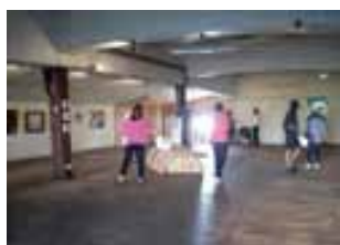
↑ 去年の作品展示の様子

三大学の有志学生が油画、日本画、デザイン、彫刻、現代表現、陶芸、グッズなどさまざまなアート作品を酒蔵の場との調和を考えて展示します。作品の販売も行っています。