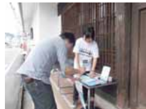
↑ 去年のスタンプラリーの様子

場所: 賀茂鶴酒造1号蔵、 福美人酒造、酒泉館、 賀茂泉酒造、山陽鶴酒造、 賀茂輝酒造、くぐり門、 亀齢酒造、西條鶴醸造、 白牡丹酒造