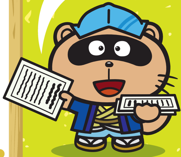
東広島市観光マスコット「のん太」