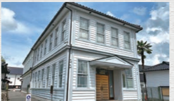
คาโมะทสึรุ