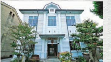
คาโมะชิซุมิ (ซูเซนคัง)