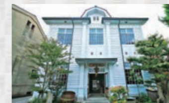
賀茂泉釀酒(酒泉館)